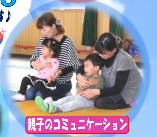
親子のコミュニケーション