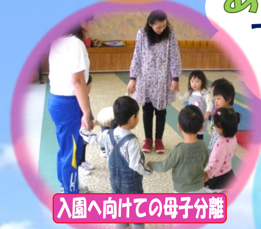
入園へ向けての母子分離