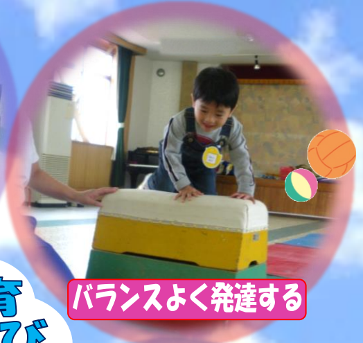
バランスよく発達する