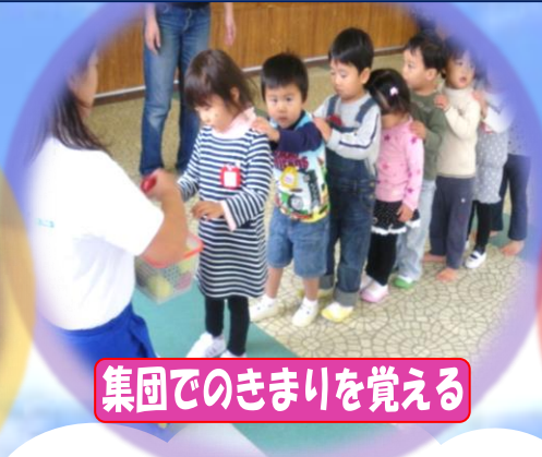
集団でのきまりを覚える