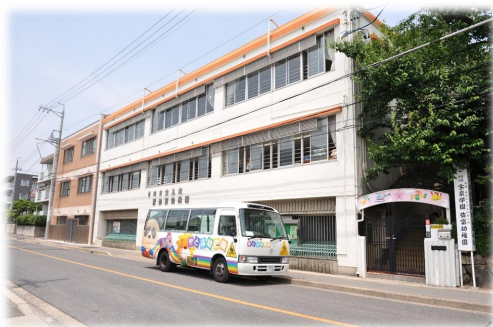
3 - 5 歳 幼児棟